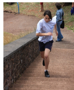
Triatlo - Prova de corrida