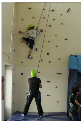
Parede de escalada-rappel

A 2ª Semana da Educação Física decorreu nos dias 6 e 7 de Abril na EBI Topo. Realizaram-se actividades tanto de carácter lúdico como de carácter competitivo, havendo uma boa adesão por parte dos alunos.