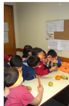
Jogo da cabra-cega

“...um momento de lazer, confraternização e convivência ...”