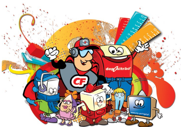
A equipa dos REEE: Capitão Fluxo; Grandão, Fresquinho, Luzinhas, Antenas e Vapores