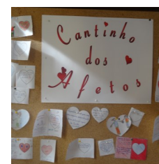
Placard do "Cantinho dos Afetos"

"... valorizar, acima de tudo, o sentimento da amizade entre as pessoas."