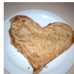
Deliciosa panqueca confeccionada pelas professoras de Línguas Estrangeiras