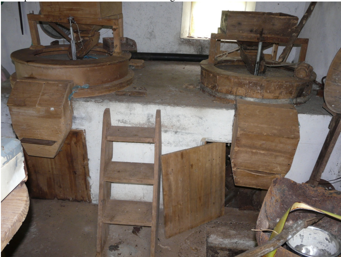
Realizado por: Diogo Brasil Fotos: Diogo Brasil.