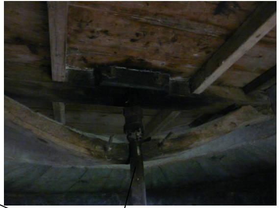
Veio (elemento que acciona o mecanismo)