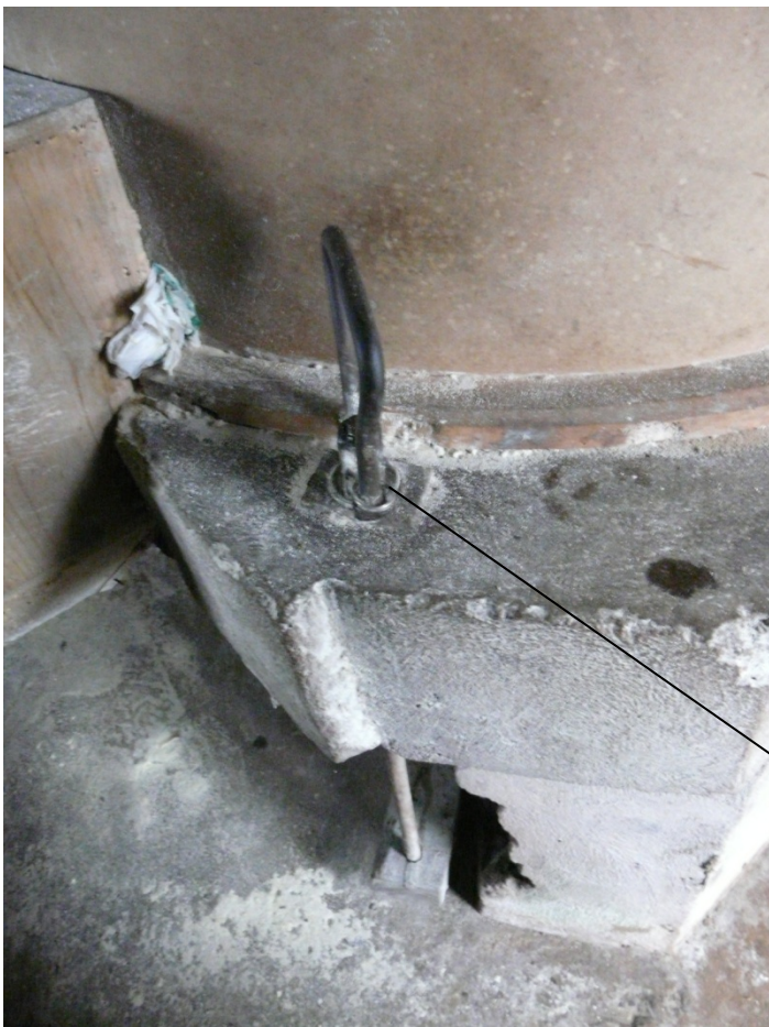
Chave (mecanismo que permite controlar a moagem).